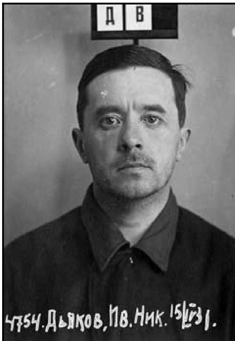
Рис. 3. Фото И.Н. Дьякова из следственного дела