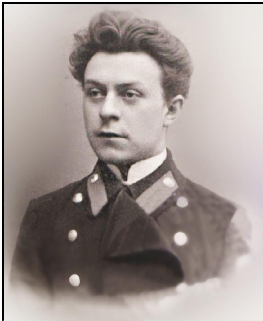
Рис. 4. Н.В. Петровский во время обучения в Московском университете (1910). Фото публикуется впервые 1