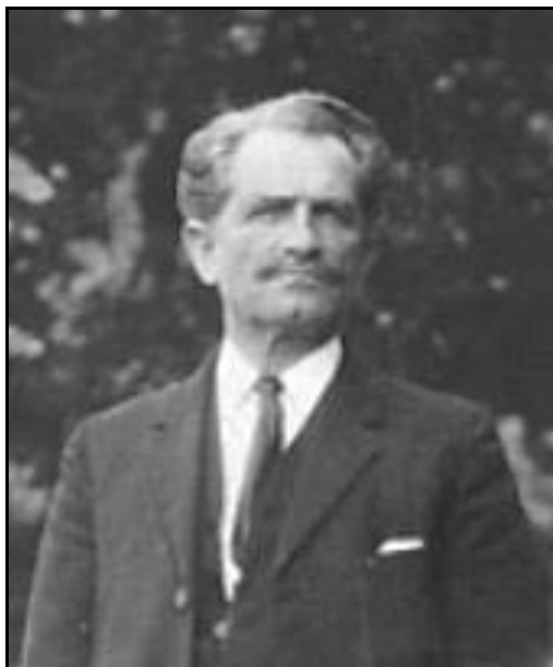
Рис. 1. Борис Сайдис (Boris Sidis) (1912)