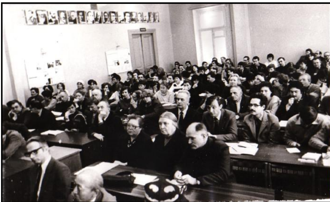
Рис. 2. В. А. Роменец среди коллег на конференции «Проблемы истории психологии» (Московский государственный университет им. М.В. Ломоносова, 27–29 января 1987 г.)

Официальными оппонентами при защите В.А. Роменцом докторской диссертации были ведущие психологи Советского Союза – К.А. Абульханова и М.Г. Ярошевский, они проанализировали его творчество и по достоинству оценили, вышедшие к тому времени, труды. Творческий диалог с этими учеными, а также с М.М. Бахтиным и С.Л. Рубинштейном, является источником его идей и доказывает, что психологическая мысль не имеет географических границ.