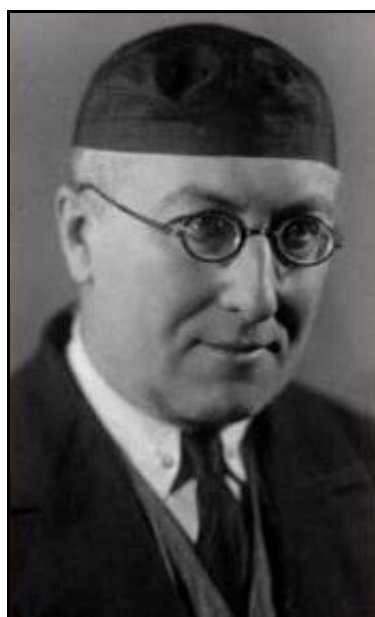
Рис. 1. А.Ф. Лосев

Keywords: A.F. Losev, psychology in education, English psychologists and teachers of the early twentieth century.