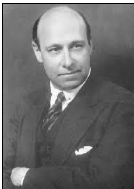
Рис. 5. Дж. К. Флюгель

Джон Карл Флюгель (13.07.1884, Ливерпуль – ?) – английский психоаналитик, историк психологии, канцлер Британского психоаналитического общества (1920-1926), почетный секретарь Британского психологического общества, почетный секретарь Интернациональной психоаналитической ассоциации (1920-1922). Рассматривал проблемы этики с точки зрения психоанализа. Известен введением понятия «комплекса Поликрата», изучением психологических аспектов одежды как выражения ухаживания [5].