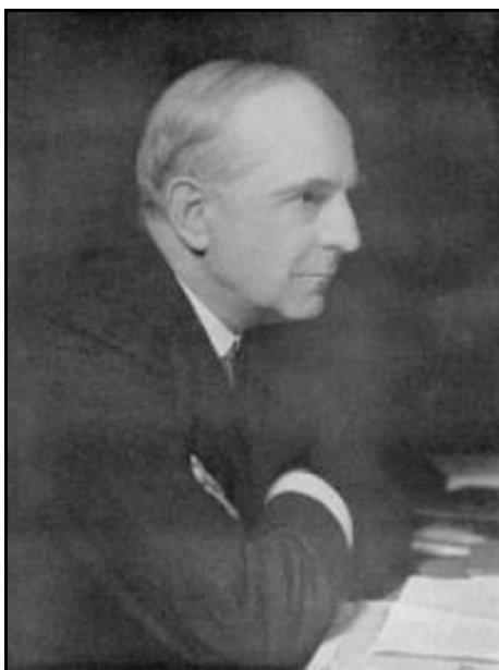
Рис. 4. Э. Джонс

Морган занимался академическим управлением. Он стал директором университетского колледжа в Бристоле в 1891 г. и сыграл центральную роль в кампании по обеспечению полного университетского статуса. В 1909 г., когда с присуждением Королевской хартии колледж стал Университетом Бристоля, он был назначен его первым вице-канцлером, офисом, который он провел в течение года, прежде чем принять решение стать профессором психологии и этики до его выхода на пенсию в 1919 г. В течение года, с 1926 по 1927 гг., учебный был президентом Общества Аристотеля. После выхода на пенсию Морган провел серию лекций Гиффорда в Сент-Эндрюсе в 1921 и 1922 гг., где он обсуждал концепцию эволюции. Умер в Гастингсе.