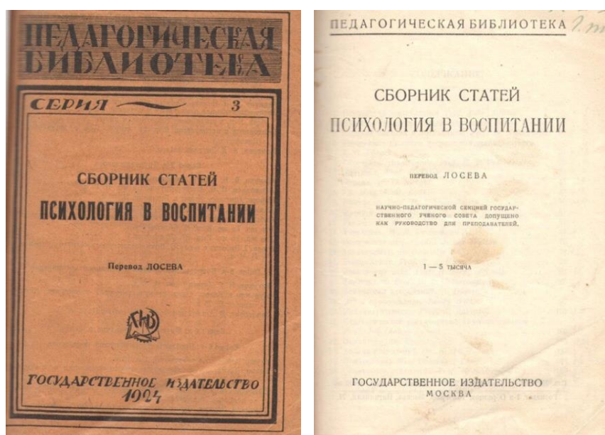
Рис. 2. Обложка и титульный лист сборника «Психология в воспитании» (1924)