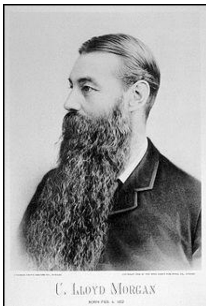
Рис. 3. К.Л. Морган

так и другие источники [2; 4; 5; 10; 11; 12].